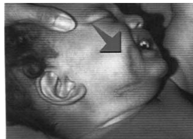
Larva migrans cutanea

Existem larvas de parasitas que não precisam de entrar pela boca, conseguem atravessar a pele e infectar assim o homem ou outros animais. Para além de terem um comportamento de maior risco, as crianças são mais sensíveis a apanhar estas doenças – tal como as pessoas de idade.