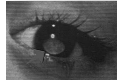
Larva migrans ocularis

Também os adultos ao apanharem um objecto do chão podem ser contaminados, claro, se levarem as mãos à boca mas também simplesmente através da pele.