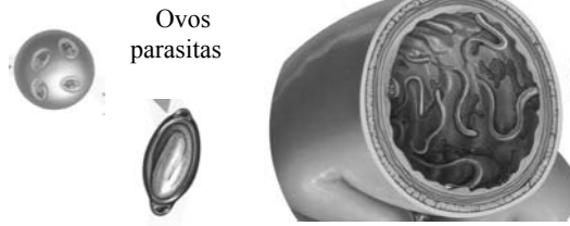
Intestino com parasita

Na realidade permanecem nestes locais mesmo depois das fezes terem desaparecido.